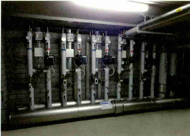
Die Verteilanlage in der Heizzentrale.