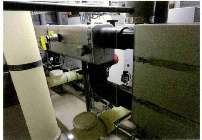
Rückansicht der Kessel mit Weishaupt-Kaskade.

Schema der Anlage (Bild: Markus Rickenbach, Bäch).