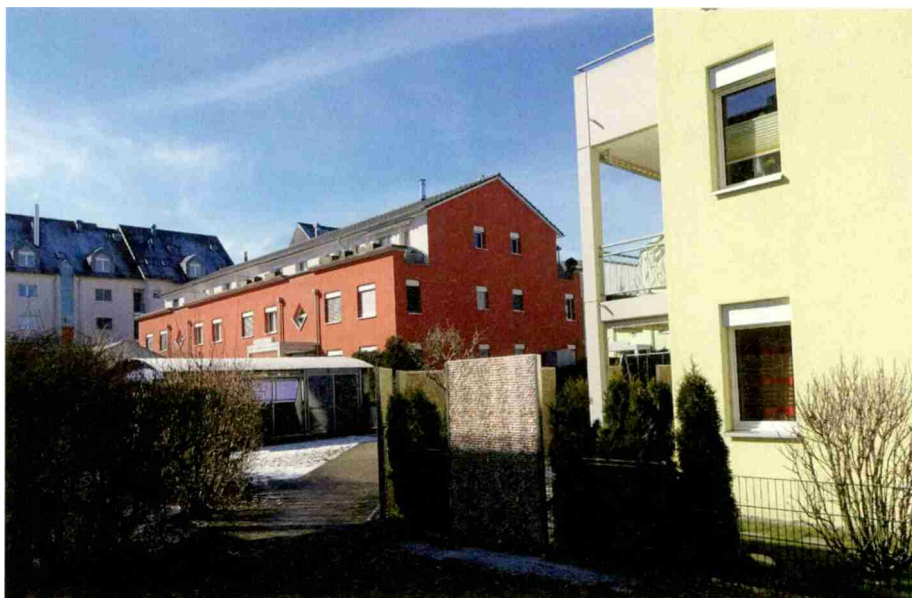
Teilansicht der Siedlung Bärenweidstrasse, Samstagern, mit Blick auf einen der Wohnblöcke.

Die Siedlung Bärenweidstrasse, Samstagern, zeigt die praktischen Probleme einer Heizungsanierung: Vom theoretisch Wünschbaren, politisch Geforderten bis hin zur einzig praktikablen, bezahlbaren Lösung: Dem Ersatz der beiden alten Kessel mit Gebläsebrenner durch zwei Weishaupt WTC-GB Gas-Brennwertkessel mit je 300 kW Leistung sowie neuen Weishaupt-Boilern in den Unterstationen.